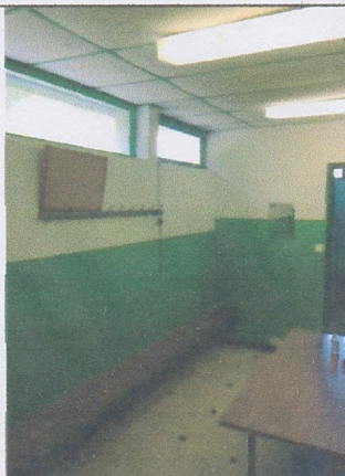
Photos vestiaire après travaux